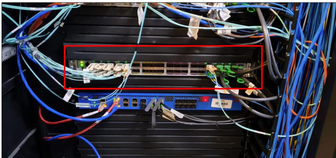
Switch modelo VDX6940-32Q

Ademais, foi possível verificar os equipamentos fornecidos e a solução implantada como um todo, em que abaixo encontra-se o registro de um dos switches: